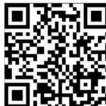
Das AJG im Film

0 59 73 60 80 30 ajg@bistum-muenster.de www.ajg.eu